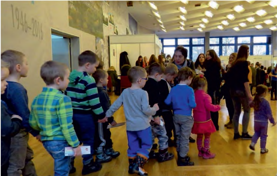
Fig. 1. The youngest participants of the Open Day at the Pedagogical University in Kraków