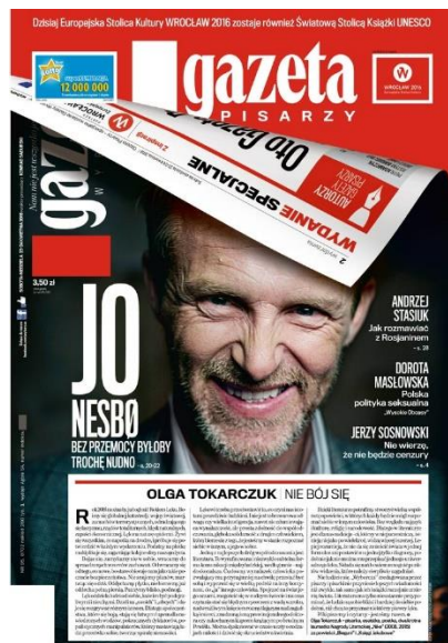
(„Gazeta Pisarzy”, 23–24 kwietnia 2016)

Zmienione i odwrócone kolorystycznie logo oraz fragment drugiej strony to ważne wizualnie elementy pierwszej strony gazety.