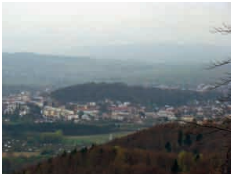
Fot. 2. Park miejski – widok z Orlego Kamienia

Park jest obiektem ogólnodostępnym, prowadzą do niego trzy zagospodarowane wejścia. Wejście od ul. Mickiewicza wiedzie przez ozdobną bramę. Wchodzimy do parku przez duży plac ograniczony od prawej strony budynkiem Towarzystwa Gimnastycznego Sokół, po lewej budynkiem II Liceum Ogólnokształcącego. Całość zamyka scena oraz Pomnik Wdzięczności. Na scenie odbywają się okolicznościowe koncerty, schody sceny prowadzą do najstarszej części ogrodu publicznego. Plac wyposażony jest w ławeczki oraz długie ławy z siedziskami biegnące wzdłuż muru oporowego. Wejście od strony południowej prowadzi od ul. Kościuszki. W tle koron buków odmiany purpurolistnej wznosi się pomnik Tadeusza Kościuszki usytuowany na placu, gdzie odbywają się uroczystości rocznicowe i patriotyczne. Wejście urządzone przy użyciu płyt piaskowca z wykorzystaniem kwater na rośliny jednoroczne i krzewy ozdobne. Wejście od strony północnej od ul. 2 Pułku Strzelców Podhalańskich wiedzie stromym podejściem wśród 80-letniego drzewostanu do miejsca zwanego Źródłem Chopina – cennej pamiątki historycznej z tryskającym z góry źródłem.