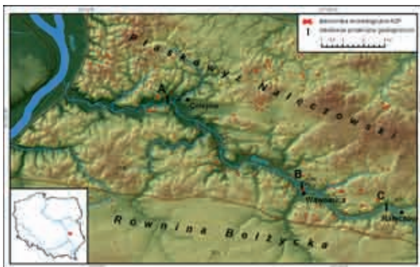
Ryc. 1. Stanowiska archeologiczne AZP na tle plastycznej mapy rzeźby zachodniej części dorzecza Bystrej