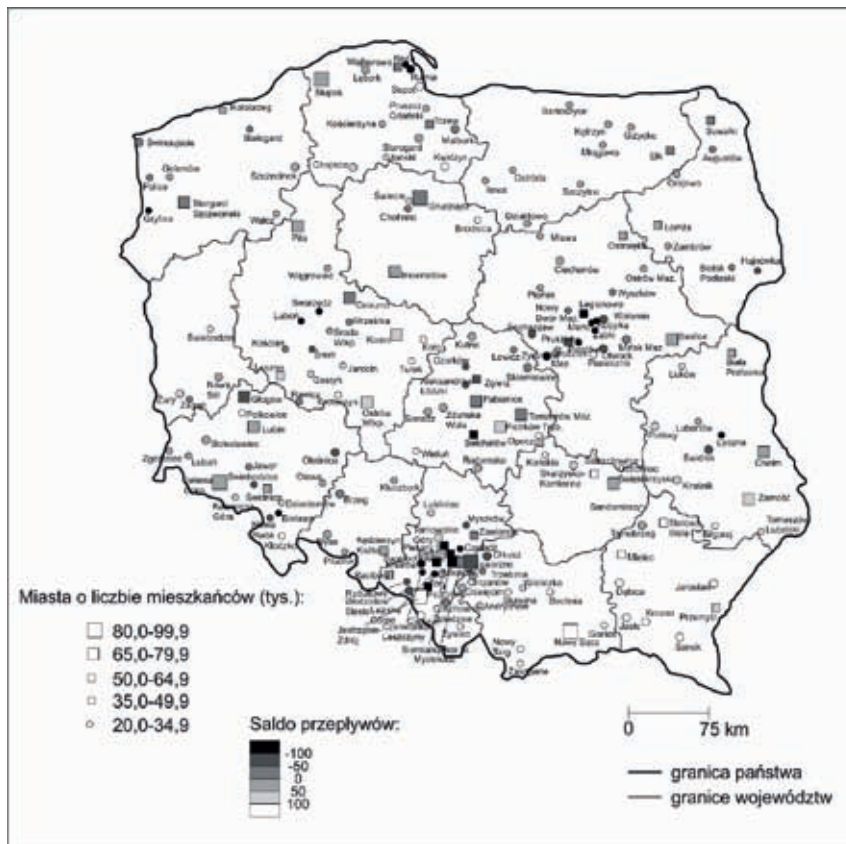
Ryc. 3. Saldo przepływów w zakresie dojazdów do pracy dla miast średniej wielkości w Polsce ( W_{sp} ) Źródło: Opracowanie własne na podstawie BDL GUS i wyników NSP 2011

Porównując wartości wskaźnika wyjazdów i przyjazdów otrzymano wskaźnik salda przepływów. Niespełna 40% miast średnich charakteryzowało się ujemnym saldem przepływów w zakresie dojazdów do pracy, czyli nadwyżką wyjeżdżających nad przyjeżdżającymi. Ogół miast średnich odznaczał się niskim dodatnim saldem wynoszącym 18,8. Wskaźnik salda przepływów wahał się od -180,7 dla Lubonia do 657,0 dla Polkowic. W grupie o najniższych wartościach wskaźnika dominują miasta województw śląskiego (9) i mazowieckiego (6). Natomiast wśród miast w najlepszym położeniu przeważają miasta województw południowych podkarpackiego (7) i małopolskiego (6). W znacznej mierze obraz wskaźnika salda przepływów w zakresie dojazdów do pracy jest zbieżny z obrazem wskaźnika wyjazdów. Miasta średnie w pobliżu dużych charakteryzują się ujemnym saldem. Bliskość tych ośrodków ma zasadniczy wpływ, gdyż są one bardziej atrakcyjnym rynkiem pracy niż miasta średnie (ryc. 3).