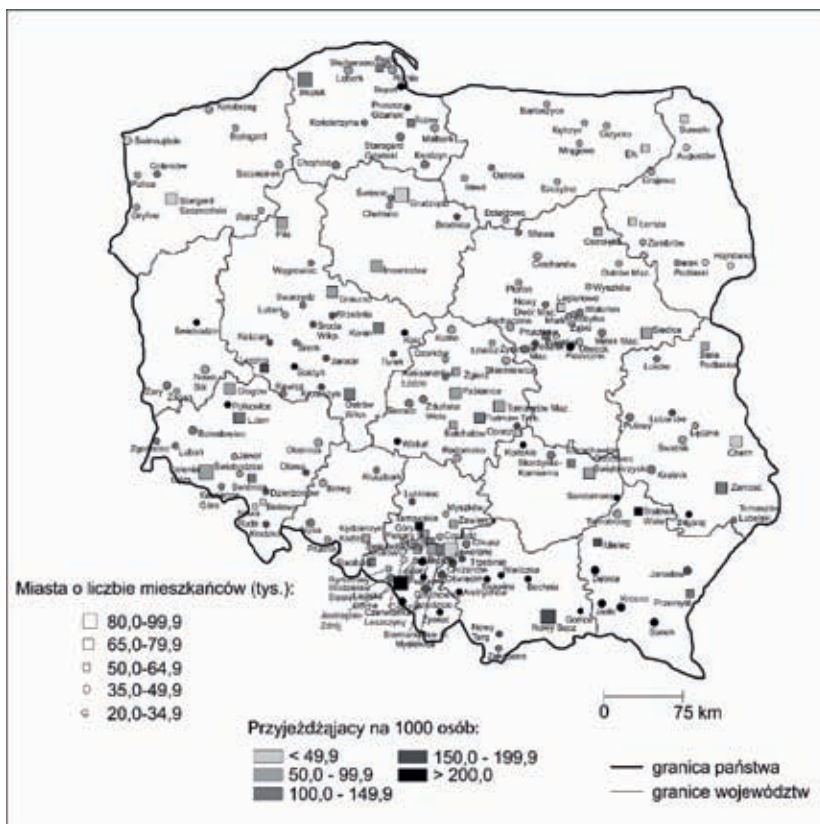
Ryc. 2. Liczba przyjeżdżających do pracy na 1000 osób w wieku produkcyjnym w miastach średniej wielkości w Polsce ( W_p )

Większe zróżnicowanie ma przestrzenny układ wskaźnika przyjazdów do pracy (ryc. 2). Średnia jego wartość dla ogółu miast średnich wynosi 129,5, przy czym wartości te wahały się od 18,1 dla Świnoujścia do 762,0 dla Polkowic. W klasie o najmniejszej mobilności przestrzennej w zakresie dojazdów do pracy dominują średnie miasta województwa podlaskiego (5). W grupie miast o najwyższym wskaźniku przyjazdów najczęściej natomiast było miast województwa śląskiego (6) oraz podkarpackiego i małopolskiego (po 5). Większe przepływy w zakresie przyjazdów do pracy notują miasta województw małopolskiego, podkarpackiego i wielkopolskiego, a przeciętnie województw pomorskiego, dolnośląskiego, łódzkiego, lubelskiego i świętokrzyskiego. Pozostałe województwa cechują się niskim wskaźnikiem przyjazdów. Warto podkreślić, iż wśród miast Górnego Śląska zaznacza się znaczne zróżnicowanie pod względem wartości tego wskaźnika przyjazdów, choć województwo to wypada przeciętnie na tle pozostałych.