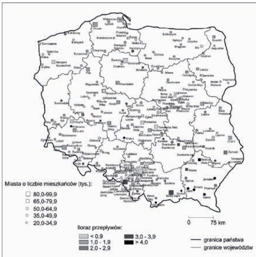
Ryc. 4. Iloraz przepływów w zakresie dojazdów do pracy dla miast średniej wielkości w Polsce ( W_{ip} ).