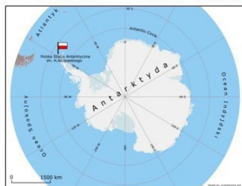
Polska Stacja Polarna im. Henryka Arctowskiego na Wyspie Króla Jerzego

Ryc. 1. Położenie Polskich Stacji Polarnych pracujących w cyklu całorocznym (opracowanie autora na bazie google.com)