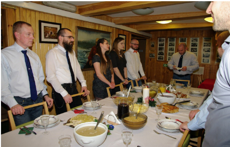
Ryc. 3. Wigilia w stacji polarnej

Składy liczebny i funkcyjny spitsbergeńskich wypraw na przestrzeni lat ulegały zmianie. Obecnie w skład uczestników ekspedycji zalicza się osoby pełniące następujące funkcje: kierownik wyprawy, sejsmolog, meteorolog, obserwator badań środowiska abiotycznego i biotycznego, informatyk, mechanik, magnetyk oraz osoby odpowiedzialne za realizację aktualnych projektów. Obecnie Polska Stacja Polarna w Hornsundzie jest nowoczesną placówką badawczą zaopatrzoną w własną elektrownię, oczyszczalnię ścieków, budynki techniczne i nowoczesne laboratoria.