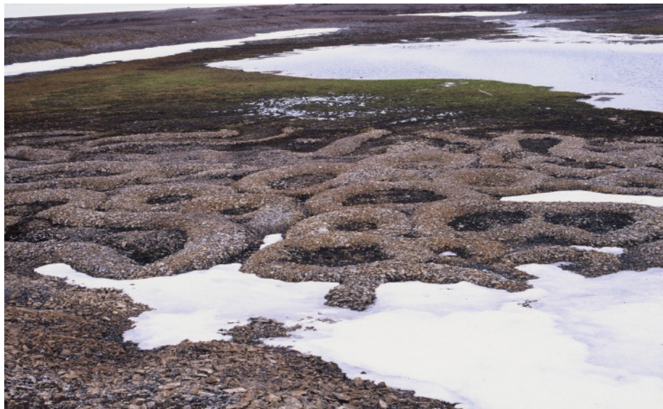
Ryc. 4. Pierścienie kamieniste. Modelowy poligon badawczy dla aktywności procesów mrozowych

możliwości do wykorzystania wyników badań z tego obszaru jako indyktorów zmian klimatycznych.