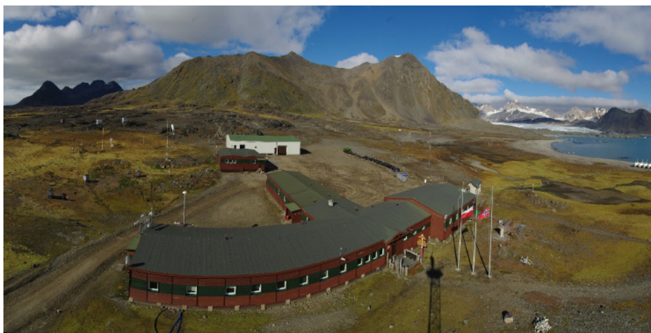
Ryc. 2. Zabudowania Polskiej Stacji Polarnej na Spitsbergenie. Stan obecny