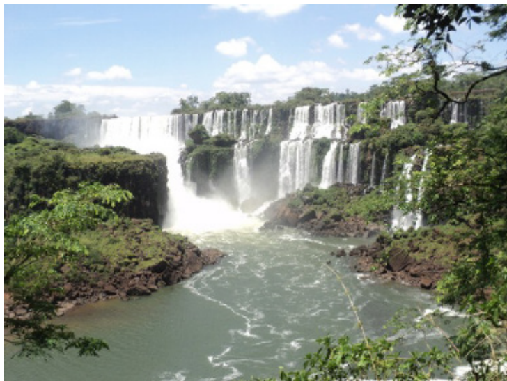
Ryc. 2. Park Narodowy Iguazu