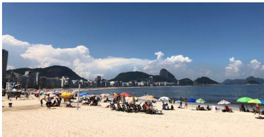
Ryc. 5. Plaża Cobacabana w Rio de Janeiro

Wśród zagranicznych kierunków wybieranych przez Polonię argentyńską zdecydowanie dominuje Brazylia. Polonia argentyńska latem odpoczywa na brazylijskiej plaży Arpoador, Ipanema oraz Cobacabana w Rio de Janeiro (Ryc. 5.).