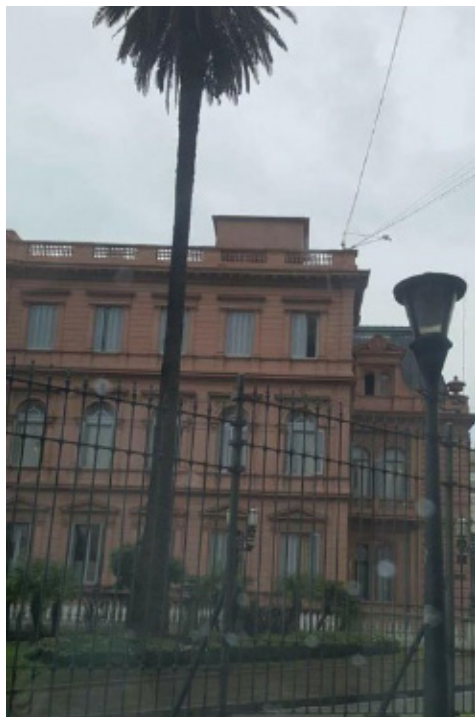
Ryc. 6. Pałac prezydencki – Casa Rosada, Buenos Aires

pojawiła się jeszcze Delta rzeki Parany w El Tigre. Spływy po Paranie odbywają się za pomocą łodzi motorowych, podczas podróży można obejrzeć bogate wille mieszkańców Argentyny, a także podziwiać przyrodę i słuchać śpiewu ptaków. Do najbardziej znanych i zdaniem ankietowanych najważniejszych atrakcji w Buenos Aires należy najszersza ulica na świecie Avenida 9 Julio i Pałac Prezydencki Casa Rosada . Z jego balkonów przemawiali najwięksi przywódcy argentyńscy. Obecnie mieści się tam muzeum, w którym zobaczyć można między innymi przedmioty związane z życiem argentyńskich bohaterów narodowych (Ryc. 6).