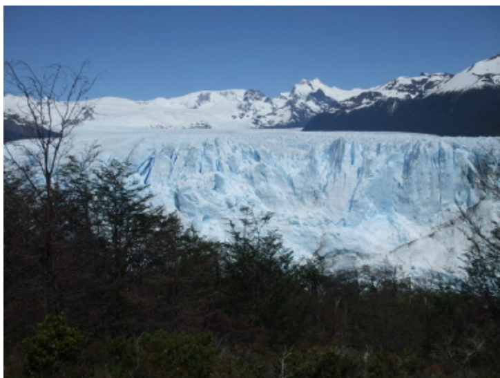
Ryc. 3. Park Narodowy Los Glaciares, Patagonia