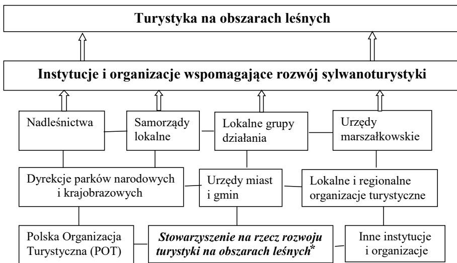
Ryc 1. Rodzaje instytucji i organizacji wspomagających rozwój sylwanoturystyki

Instytucje i organizacje uczestniczą w podejmowaniu decyzji dotyczących organizacji, funkcjonowania i rozwoju infrastruktury technicznej i społecznej. Działalność turystyczną na obszarach leśnych w Polsce wspierają lub mogą wspierać różne instytucje i organizacje