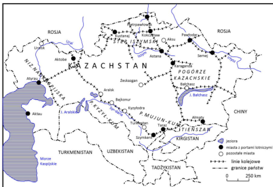
Ryc. 1. Mapa Kazachstanu (opracowanie własne)

się liczne słone jeziora (m.in. pozostałości Jeziora Aralskiego i jezioro Bałchasz, którego zachodnia część jest słodkowodna) i sieć koryt rzek okresowych. Dalej ku północy rozciąga się pas nizin i wyżynnych stepów (ok. 30% powierzchni kraju). Obejmuje on zachodnią i północną część kraju, sięgając od Niziny Nadkaspjskiej, przez wzniesienia Mugodżarów (pd. kraniec Uralu) i Wyżyny Turgajskiej, do bardzo rozległego Pogórza Kazachskiego (m.in. step Sary Arka, pojedyncze pasma gór niskich i średnich – do 1565 m n.p.m., szerokie obniżenia z jeziorami i solniskami oraz półpustynny płaskowyż Betpak Dała w części południowej). Najbardziej północną część kraju zajmuje skraj Niziny Zachodniosyberyjskiej (Step Iszymski, dolina rzeki Irtysz). Generalizując regionalnie typy krajobrazu można uznać, że w północnej połowie kraju dominują cechy rzeźby typowe dla Syberii, a w południowej dla Azji Środkowej.