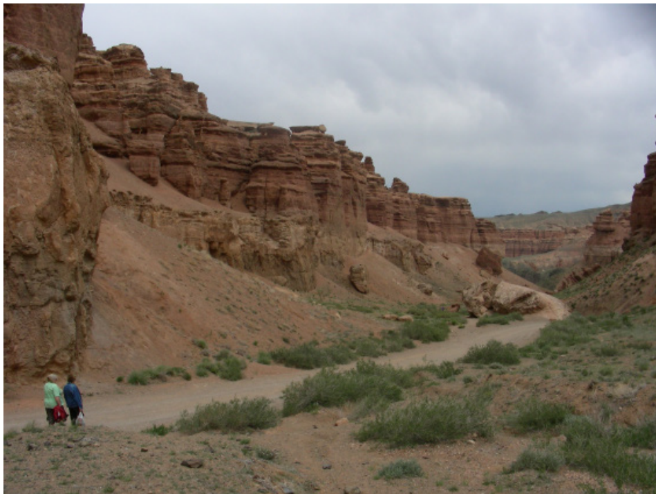
Fot. 4. Dolina Zamków w Kanionie Szaryńskim

Kanion Szaryński znajduje się na przedpolu Tienszanu. Został on wycięty erozyjnie w piaskowcach i zlepieńcach poprzecinanych żyłami wulkanitów przez rzekę Szaryn. Wysokość jego ścian skalnych sięga 200 m. Przypomina wyglądem Wielki Kanion Kolorado w USA, jakkolwiek rozmiarami zdecydowanie mu ustępuje. Najciekawszą, najczęściej odwiedzaną i dobrze zagospodarowaną turystycznie jego częścią jest tzw. Dolina Zamków (Fot. 4).