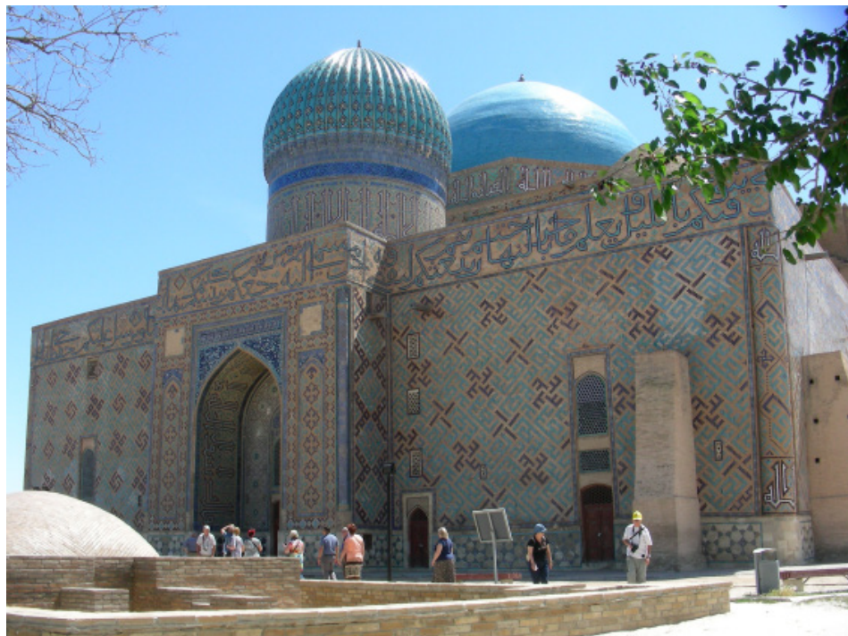
Fot. 5. Turkmenistan – Mauzoleum Chodży Ahmada Jasawiego

Ważnym niegdyś ośrodkiem na Jedwabnym Szlaku było miasto Otrar (Farab, VIII-XVIII w.), położone u podnóża gór Karatau. Dziś turyści mogą oglądać ruiny tego – miasta, częściowo odrestaurowane i zabezpieczone mury pałacu, meczet i ruiny łaźni. W Otrarze w roku 1405 zmarł Timur. W pobliżu ruin znajduje się okazałe, średniowieczne (XIV w.) Mauzoleum Arystan Baba (mistyka, nauczyciela innego mistyka i poety – Chodży Jasawiego).