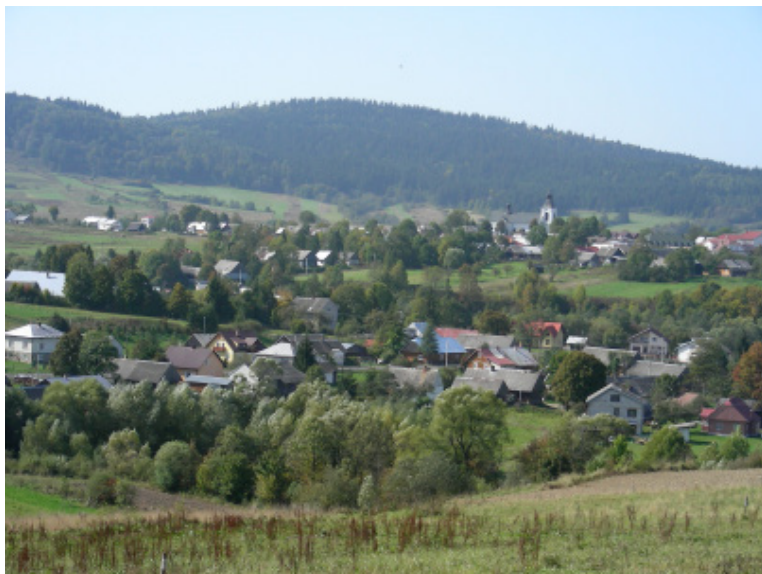
Ryc. 2. Dawna część Jaślik jest usytuowana na wysokiej skarpie nad rzeką Jasionką