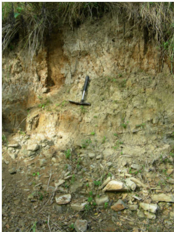
Ryc. 5. Droбноziarnista mada w brzegu koryta Jasiołki w Jasielu