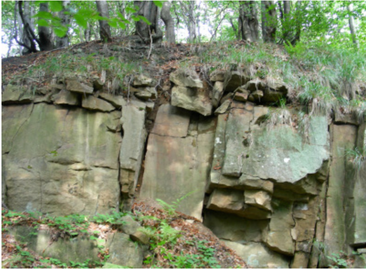
Ryc. 3. ławice piaskowców przybyszowskich w kamieniołomie „Okragła Wyspa”

beładnej (miejscami z widocznym warstwowaniem frakcjonalnym). Ponadto mają one średnią zwięzłość (spoiwo ilasto-krzemionkowe), są bezwapniste, a w ich składzie mineralnym występuje kwarc, skalenie, miki oraz okruchy skał osadowych i metamorficznych. Mają barwę ciemnobrązową, a po zwietrzeniu rdzawo-żółtą (Bromowicz, 1982). Ich zasoby oszacowano na 5,5 mln ton (Peszat i in., 1985). Zależą przy ich eksploatacji jest niewielki upad ławic (w kierunku południowym) i becnosć w ławicach poprzecznych spēkań. Zespół tych spēkań jest względnie rzadki, co decyduje o dużej blocznosci ławic i warunkuje pozyskanie podczas eksploatacji bloków skały nawet o znacznych rozmiarach.