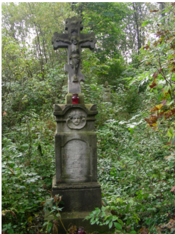
Ryc. 4. Jeden z kamiennych pomników nagrobkowych na cmentarzu w Lipowcu

Piaskowce pozyskiwane z łomów na Kamieniu były materiałem stosowanym nie tylko w lokalnym budownictwie, ale były także obrabiane przez miejscowych kamieniarzy. Rejon Jaślik słynął w przeszłości (zwłaszcza w XVIII w.) z rzemiosła kamieniarskiego i w ujęciu etnograficznym określa się go nawet mianem „kamieniarskiego regionu jaślickiego” (Reinfuss, 1989; Stachowiak 2001a). Jego głównymi ośrodkami były wsie Lipowiec i Olchowiec, słynne z kamieniarki artystycznej, zwłaszcza rzeźby ludowej (Stachowiak, 2001a; Bromowicz, 1982). Piaskowiec przybyszowski jest bowiem łatwy do obróbki. Dziełami miejscowych kamieniarzy są m.in. stojące do dziś schodkowe cokoły i krzyże kamienne (9) wzdłuż „winnego traktu handlowego” wiodącego z przełęczy Beskid do Jaślik lub wzdłuż innych dróg wiejskich, krzyże nagrobkowe na okolicznych cmentarzach (ryc. 4) oraz znajdujące się jeszcze w niektórych gospodarstwach przedmioty użytkowe jak: żarna, brusy osełki, a nawet kamienie młyńskie (Stachowiak 2001b; Welc, 2010). Wyroby z miejscowych warsztatów kamieniarskich wysyłano w minionych wiekach także poza rejon Jaślik (Welc, 2010).