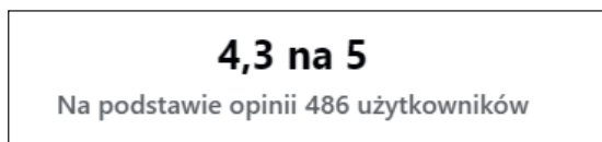
Ryc. 4. Zrzut ekranu z ogólną oceną Muzeum-Zamku w Łąncucie z portalu Facebook