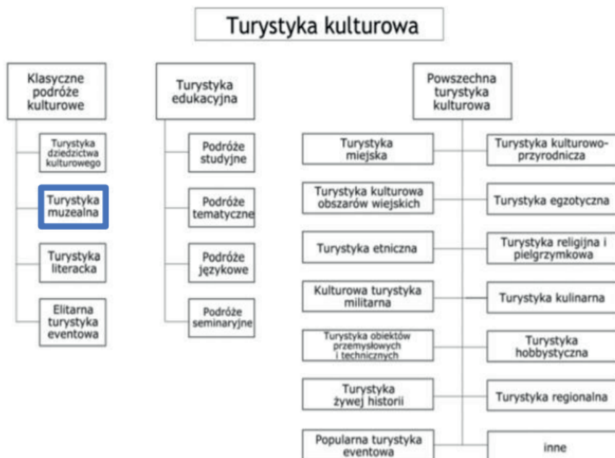
Ryc. 1 Podział turystyki kulturowej.

Chcąc zaklasyfikować tematykę swej pracy do rodzaju turystyki, autorka wybrała część problematyki turystyki kulturowej, czyli turystykę muzealną (ryc. 1). Zamek w Łańcucie wchodzi w skład tamtejszego Muzeum-Zamku, a Pałac w Przeworsku w skład Zespołu Pałacowo-Parkowego w tym mieście. Oba te miejsca mają status muzeów. Jak podaje definicja turystyki muzealnej z książki Mikosa von Rohrscheidta Turystyka kulturowa. Fenomen, potencjał, perspektywy „Jako turystyka muzealna określane są te przedsięwzięcia o charakterze turystycznym, dla których głównym motywem podjęcia podróży i celem tejeż jest wizyta w jednym lub kilku obiektach