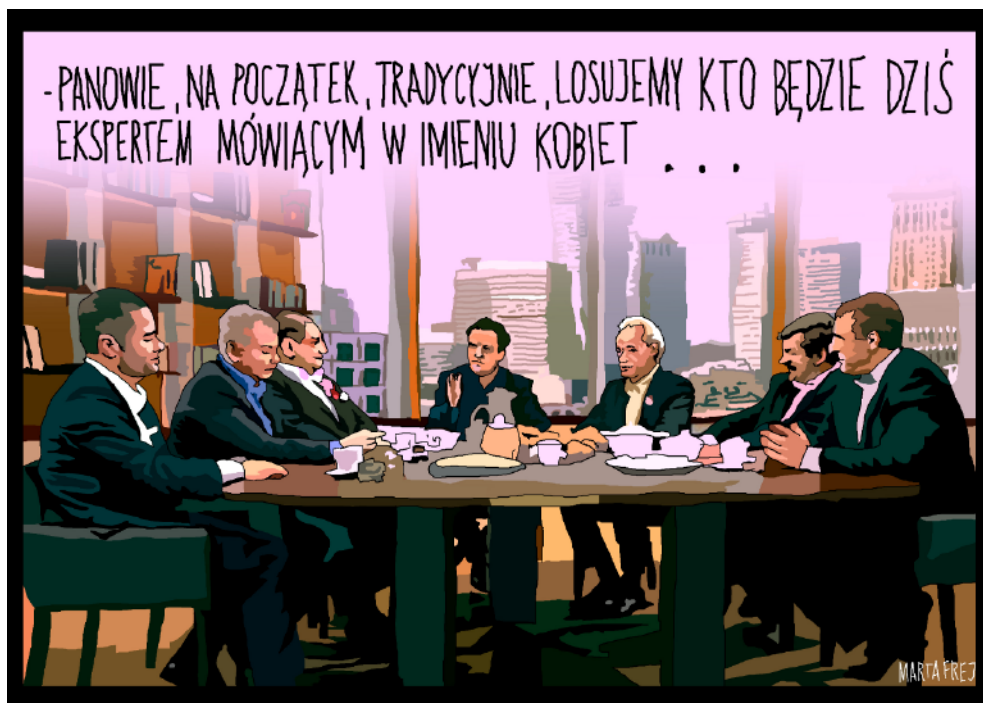
Obraz 1. Rysunek satyryczny ukazujący problem braku obecności kobiet w programach publicystycznych