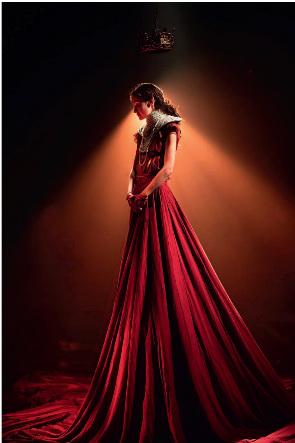
Il. 5. Córki powietrza. Sen Balladyny , J. Osyda (Starsza Siostra); fot. E. de Poray