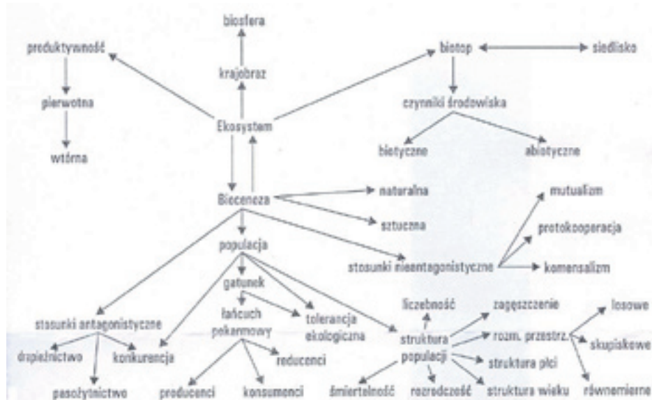
Ryc. 1. Struktura treści ekologicznych liceum ogólnokształcącego

Na podstawie dokonanej analizy programów opracowano strukturę wiedzy ekologicznej ucznia liceum ogólnokształcącego (Ryc. 1).