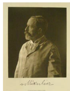
Portret Jana Mikulicza-Radeckiego*

Profesor Jan Mikulicz-Radecki doczekał się wielu publikacji traktujących o jego nieocenionym wkładzie w rozwój współczesnej chirurgii. Uczony urodził się 16 maja 1850 roku w Czerniowicach. Kwestia jego narodowości budziła wiele sporów. Sam profesor pytany o to odpowiadał, iż jest chirurgiem 1 . Mikulicz-Radecki podjął studia medyczne wbrew woli ojca, który odmówił mu pomocy finansowej. Przyszły chirurg musiał sam zarabiać na swoje utrzymanie. Pierwszym etapem jego znakomitej kariery była nauka w II wiedeńskiej klinice chirurgicznej u cieszącego się wielkim uznaniem profesora Billrotha. W 1880 r. Mikulicz-Radecki ożenił się. Kolejnym etapem jego kariery był Kraków, gdzie objął Katedrę i Klinikę Chirurgiczną UJ, następnie Katedrę w Królewcu, a 1 października 1890 roku – wrocławską Katedrę i Klinikę Chirurgii 2 . Profesor poświęcił wiele uwagi aseptyce w chirurgii, jako pierwszy wprowadził jedwabne rękawiczki przy wykonywaniu zabiegów oraz maski operacyjne 3 . Zawdzięczamy mu istnienie wielu narzędzi chirurgicznych, m.in. gastroskopu, który stworzył wraz z konstruktorem urządzeń medycznych Józefem Leiterem 4 . Jego nazwiskiem określamy niektóre jednostki chorobowe. Celowo pomijam szczegóły dotyczące kariery zawodowej. Celem niniejszej pracy nie będzie refleksja nad zasługami Profesora na polu chirurgii. Ich analizę zostawmy historykom medycyny.