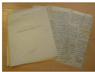
Fragment maszynopisu rozprawy habilitacyjnej Zdzisława Wiktora