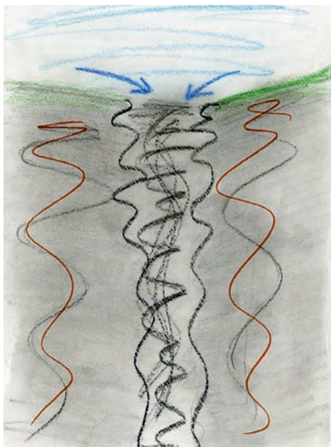
Рис. 2. Пример представления подростками об одиночестве как о крушении

В данном контексте ключевым моментом организации семантики образов одиночества становится недостаточный субъективный опыт подростков в развитии коммуникативных компетентностей, обусловленный дефицитарностью социальных подкреплений при форматировании личностных сценариев поведения.