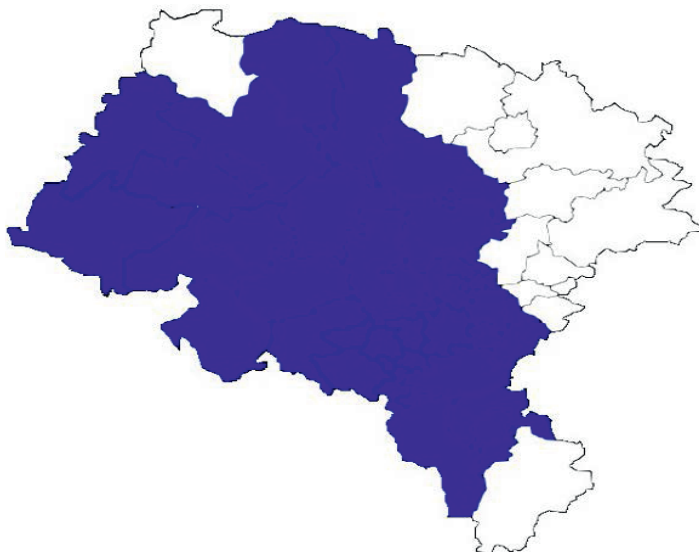
Ryc. 1. Mapa Regionu Autonomicznego Górny Śląsk

W skład autonomicznego województwa śląskiego mają wejść tylko ziemie uznane za historycznie należące do Górnego Śląska 29 , co oznacza, że tereny dawnego województwa częstochowskiego 30 i część Podbeskidzia mają znaleźć się w innych regionach 31 . Region Autonomiczny Górny Śląsk posiadałby własne godło oraz flagę.