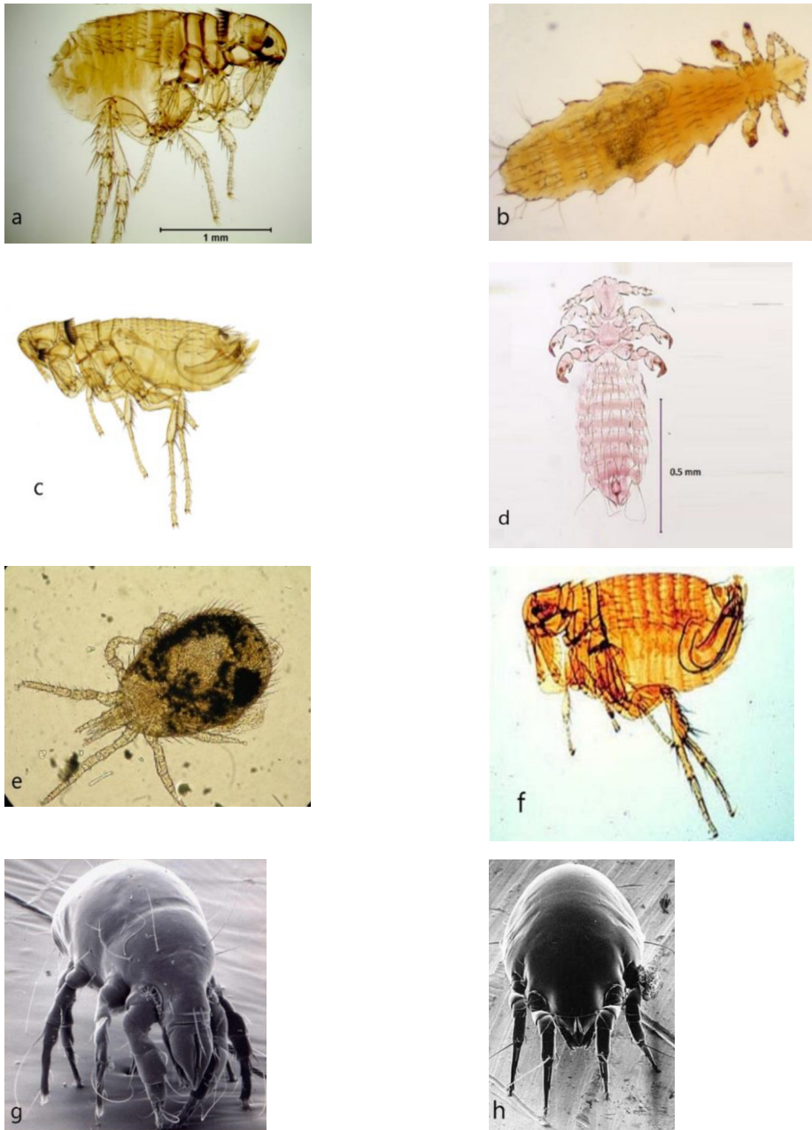
Ryc. 1. Ctenocephalides canis – a, Polyplax serrata – b, Leptopsylla segnis – c, Polyplax pinulosa – d, Ornithonyssus bacoti – e, Xenopsylla cheopis – f, Acarus siro – g, Chortoglyphus arcuatus – h