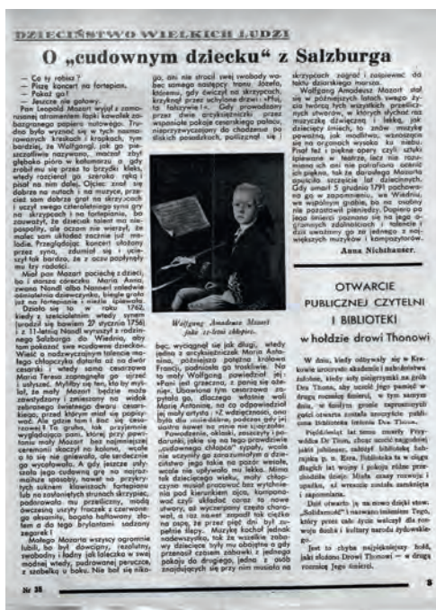
Il. 3. „Okienko na Świat” 1938, nr 35, s. 3