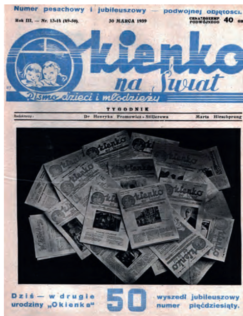
Il. 4 „Okienko na Świat” 1939, nr 13/14, s. 1, skan z zasobów BN w Warszawie

z Krakowa, ale mocną grupę tworzyli też odbiorcy z Lwowa i okolic, Małopolski, Lubelszczyzny i Rzeszowszczyzny. W ten sposób otwierały się przed nimi nowe możliwości poznawcze, wzbogacające ich doświadczenie egzystencjalne.