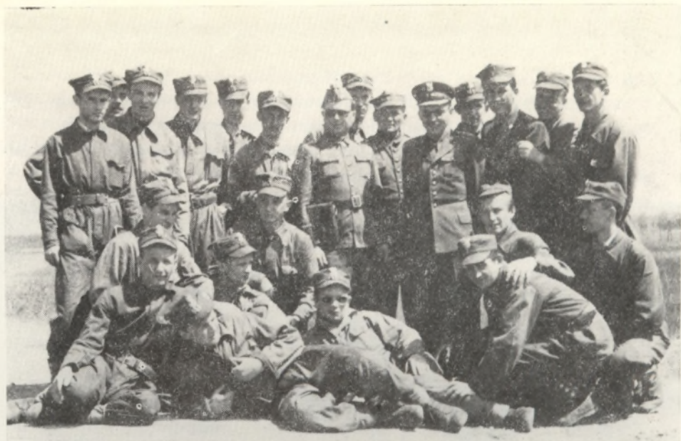
Grupa studentów z wykładowcami po zajęciach Studium Wojskowego w terenie w 1952 r.