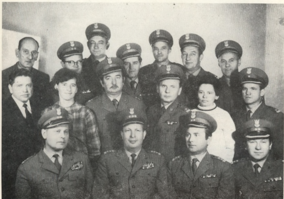
Pracownicy Studium Wojskowego w 1971 r.