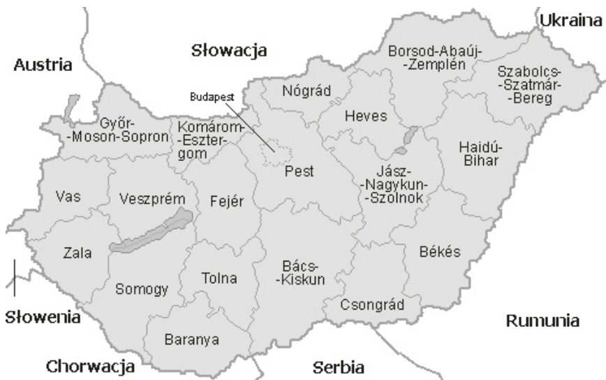
Ryc. 1. Podział Węgier na komitaty

W ramach ustaw samorząd terytorialny realizuje w stosunku własności samorządowej prawa przysługujące właścicielowi, czyli może dysponować swoim mieniem, gospodarować samodzielnie swoimi dochodami. Może także na własną odpowiedzialność prowadzić działalność gospodarczą. Ponadto w sposób niezależny kształtuje swoją organizację i tryb działania. Konstytucja przewidziała również możliwość swobodnego zrzeszania się jednostek samorządowych w celu reprezentowania interesów wobec organów państwa zarówno centralnych, jak też lokalnych (do najważniejszych stowarzyszeń należą Stowarzyszenie Węgierskich Władz Lokalnych, Federacja Węgierskich Władz Lokalnych, Narodowa Federacja Władz Lokalnych). Lokalny organ przedstawicielski może współpracować z samorządem lokalnym innego państwa, jak też może być członkiem międzynarodowych organizacji samorządowych 7 .