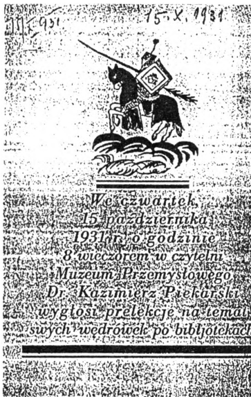
Ryc. 4. Zawiadomienie o odczycie K. Piekarskiego. Reprod. oryg. ze zbiorów Biblioteki PAN w Krakowie, sygn. 136375