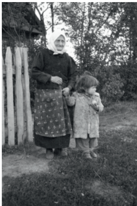
Ryc. 3. Autor: J. Ficowski (Narodowe Archiwum Cyfrowe, zespół nr 65 Archiwum audiowizualne Jerzego Ficowskiego, sygn. rob. koperta 19 fot. 76)