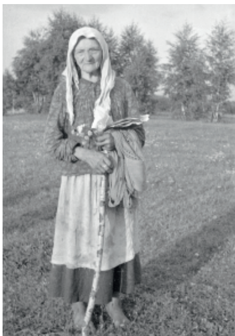
Ryc. 4. Autor: J. Ficowski (Narodowe Archiwum Cyfrowe, zespół nr 65 Archiwum audiowizualne Jerzego Ficowskiego, sygn. rob. koperta 19 fot. 40)