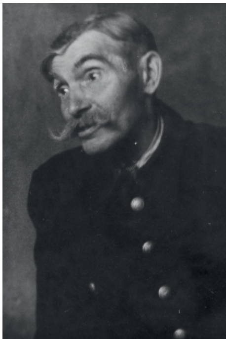
Ryc. 2. Autor: J. Ficowski (Narodowe Archiwum Cyfrowe, zespół nr 65 Archiwum audiowizualne Jerzego Ficowskiego, sygn. rob. koperta 19 fot. 17)