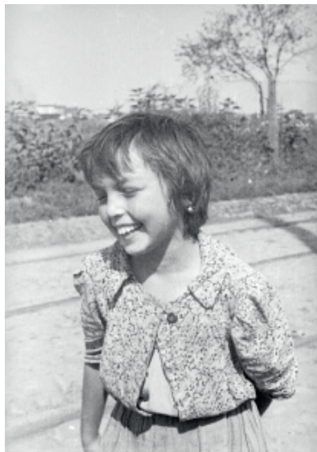
Ryc. 1.

Wiele fotografii odzwierciedla zainteresowania badawcze Jerzego Ficowskiego 4 . Są tu więc niezwykle ważne dla jego pracy i twórczości piśmienniczej fotografie cygańskie: zarówno negatywy, jak i odbitki pozytywowe. Wiele z nich Ficowski wykonał osobiście podczas podróży z taborem. Zdjęcia autorstwa Ficowskiego 5 pokazują życie codzienne tych ludzi, są portrety i fotografie sytuacyjne dzieci i dorosłych. W niektórych z nich uderza wręcz bezpośredniość, wyraźny jest brak dystansu pomiędzy fotografem a modelami, a efekt taki nie jest łatwy do osiągnięcia nawet dla profesjonalisty.