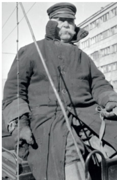
Fot. 5. Autor: J. Ficowski (Narodowe Archiwum Cyfrowe, zespół nr 65 Archiwum audiowizualne Jerzego Ficowskiego, sygn. rob. koperta 19 fot. 68)

Dla dopełnienia obrazu tej części twórczości Ficowskiego można przytoczyć fragment listu poety do wydawnictwa „Czytelnik” z prośbą o wydanie artykułów w formie książkowej. Jerzy Ficowski pisze, że Karty z raptularza to: „...parostronicowe szkice literackie o ostatnich Mohikanach dawnego obyczaju, żyjących dziś jeszcze wśród nas. Każdy ze szkiców zilustrowany jest wykonaną przeze mnie fotografią. Zarówno treść „ Kart z raptularza ”, jak i ich fotograficzne dopełnienie ma charakter dokumentu, utrwalającego głównie przejawy wygasającego folkloru miejskiego a także wiejskiego. Każda z kart mówi o jakiejś konkretnej, autentycznej postaci, żyjącej do dziś lub do niedawna reprezentującej bądź to jakąś niknącą lub zanikłą profesję, bądź to będącej nosicielem resztek wymarłych obyczajów, bądź też stanowiącej żywe źródło cząstki naszej przeszłości narodowej. Ludzie ci to na przykład doróżkarz warszawski, opiekunka gołębi staromiejskich, stary kolejarz z podwarszawskiej kolejki” 8 .