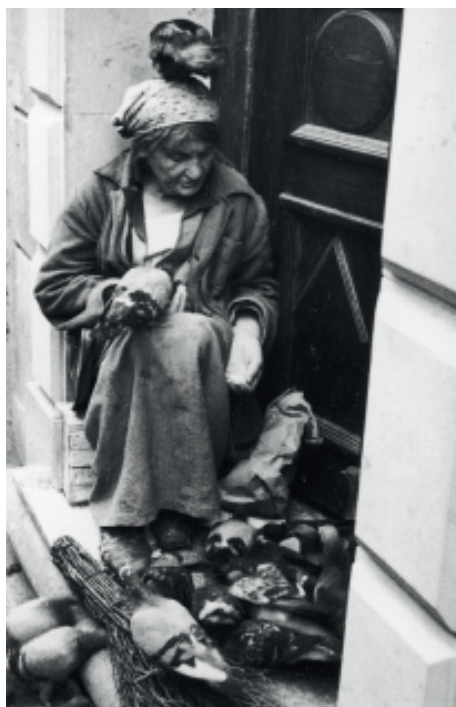
Fot. 6.