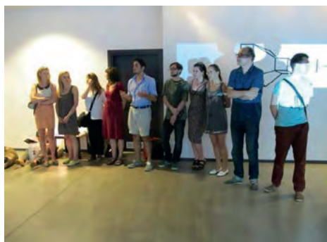
Wernisaż wystawy „Intermedium”