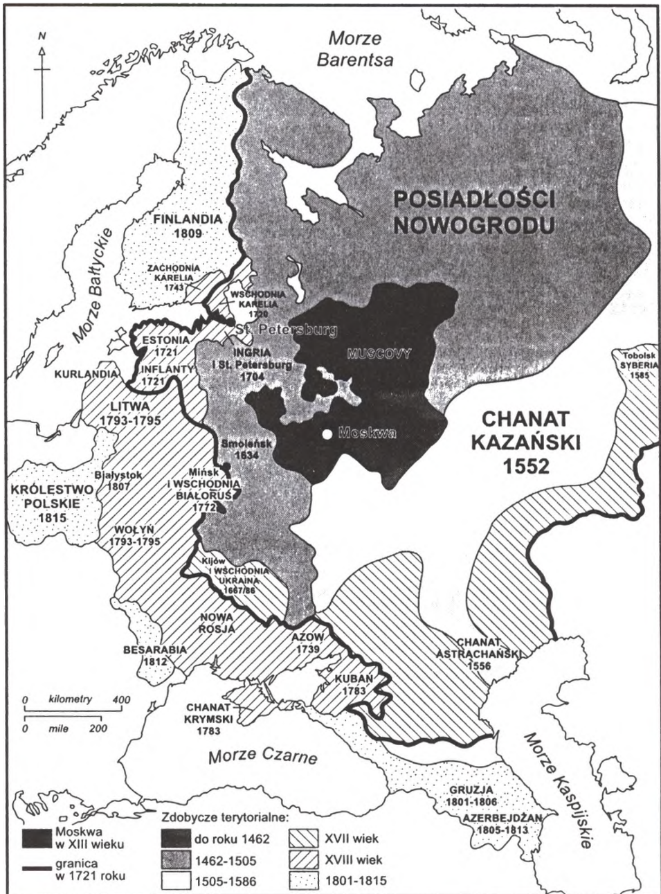
Ryc. 1. Ekspansja Rosji w Europie (1552-1815)

Źródło: Davies N., 1998. Europa . Znak, Kraków