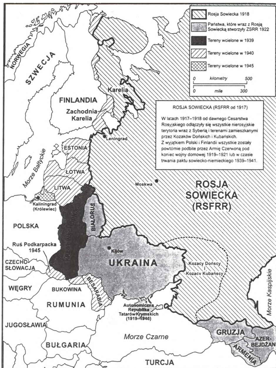
Ryc. 2. Sowiecka ekspansja terytorialna w Europie (1917-1945)

Źródło: Davies N., 1998. Europa . Znak, Kraków