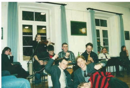
Wystawa prac plastycznych uczniów LO połączona z koncertem reagge