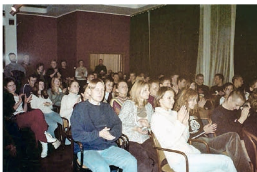
Uczniowie na wystawie w Ośrodku Kultury im. C. K. Norwida