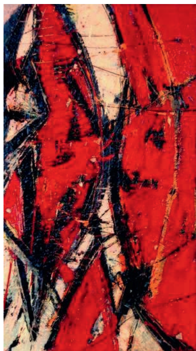
M. Batorski, Cotrane mood , olej, płótno