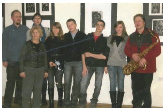
Wieczory jazzowe na Woli Justowskiej