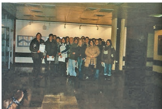
Spotkanie w wybitnym krakowskim artystą Leszkiem Dutką w NCK