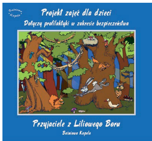
Fot. 3. Okładka płyty CD Przyjaciele z Liliowego Boru z projektem zajęć dla dzieci dotyczącym profilaktyki w zakresie bezpieczeństwa

stosownej recepcji 39 . Szkoda, gdyż książka ta zasługuje na uwagę, choćby ze względu na sposób, w jaki została w niej zaadaptowana prawdziwa i tragiczna historia bohaterskiego chłopca. Należy podkreślić, że autor potraktował temat z dużym wyczuciem. Owa stosowność w podejściu do rzeczywistych wydarzeń jako kanwy do stworzenia dzieła o charakterze beletrystycznym odzwierciedliła się m.in. w zmianie danych personalnych głównego bohatera, unikaniu zbędnych chwytów literackich, w końcu – przez umiejętne rozłożenie emocji na poszczególne fazy utworu. Siła oddziaływania omawianej w niniejszym artykule książki polega także i na tym, że – nie będąc wytworem produkcji masowej, lecz raczej produktem rzemiosła, udostępnionym w ograniczonej liczbie – może być przekazywana z pokolenia na pokolenie. Nawet nie wśród samych mieszkańców Jerzmanowic-Przegini, przyszlých potomków obecnych czytelników, ale też przez osoby, które bezpośrednio spotkały się z Baśniową Kapelą w różnych zakątkach Małopolski. Może też kiedyś Liliowy Bór trafi na półki zbieraczy wydań, których nakład nie przekroczył liczby produkcji masowej. Wówczas osiągnie swój nadrzędny cel – stanie się nośnikiem pamięci pokolenia, żyjącym wraz z nim i przeżywającym go zgodnie z naturalnym porządkiem biologicznym. Bo – jak pisał Deyan Sudjic w znakomitej książce Język rzeczy – pozbyć się takiego przedmiotu to „jak pozbyć się kawałka życia” 40 .