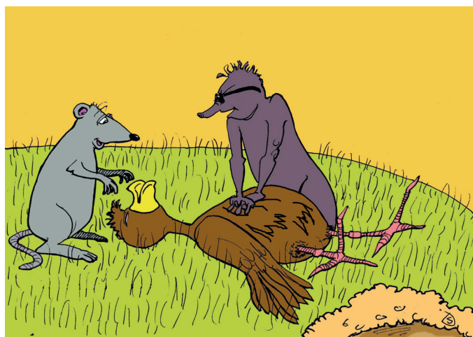
Fot. 2. Lekcja pierwszej pomocy w wykonaniu bohaterów Liliowego Boru

Przedstawiona historia uświadamia czytelnikowi, że sama znajomość numerów do jednostek ratunkowych nie wystarczy. Potrzebna jest jeszcze wiedza z zakresu ratownictwa przedmedycznego. Właśnie dzięki takiej postawie Kreta i Myszki historia Kosa Bemola mogła się zakończyć szczęśliwie.