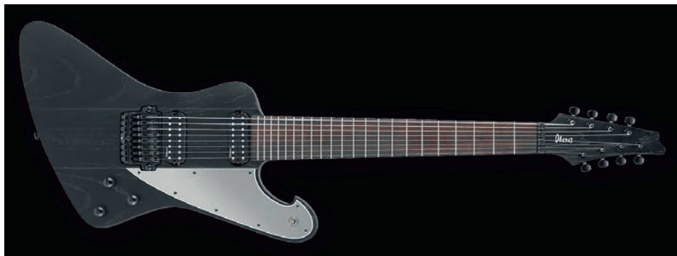
Ilustracja 1. Gitara 8-strunowa używana przez Fredrika Thordendala, https://www.megamusiconline.com.au/ibanez-ftm33-wk-fredrik-thordendal-meshuggah-signature-8-string-electric-guitar-weather-red-black

power chordu (Thomson 2011). Przyjmuje się, że po raz pierwszy użył go Fredrik Thordendal, gitarzysta szwedzkiego zespołu Meshuggah, który około 2002 roku rozpoczął eksperymenty z siedmio- i ośmiostrunowymi gitarami, cyfrowym przetwarzaniem dźwięku i abstrakcyjnymi polirytmiami.