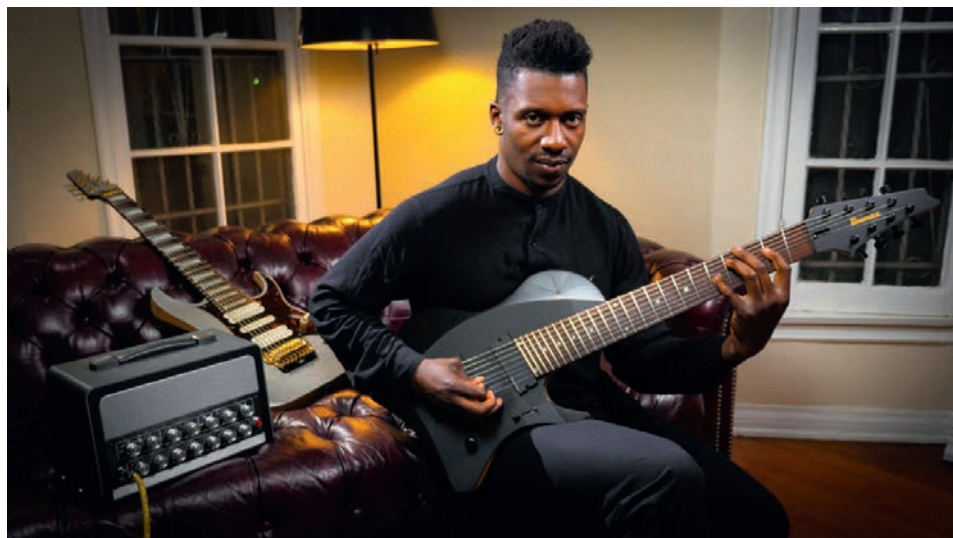
Ilustracja 3. Tosin Abasi, https://www.youtube.com/watch?v=xQWQjZxf54g