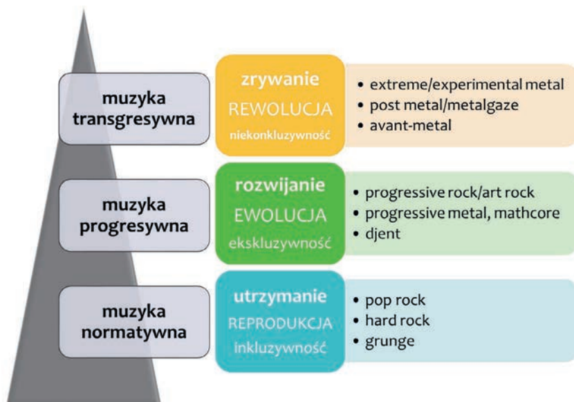
Ilustracja 5. Alternatywna typologia muzyki popularnej

pojęć modernizm–awangarda–postmodernizm, za to wychodzącego od kluczowego dla omawianego podgatunku metalu słowa „progresywny”.