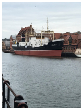
Fot. 2. Statek – muzeum Sołdek