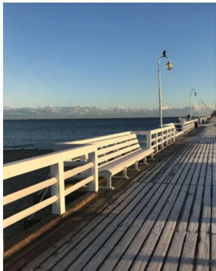
Fot. 1. Molo w Sopocie

tu z surową i stateczną bielą drewna. Molo łączy walory romantycznego pleneru z domeną konsumpcji i rozrywki, aliaż znany z okresu, kiedy Sopot stawał się popularnym uzdrowiskiem. Najlepiej ukazują to filmy, których akcja rozgrywa się w czasach przedwojennych, gdy kurort był częścią Wolnego Miasta, takich jak Medium albo też filmy Pawła Pitery Szkatułka z Hongkongu i serial Na kłopoty Bednarski . Symbolami okolicy nadmorskiej są w nich: molo, deptak, wyścigi konne, kasyno, chiński pawilon. Skojarzenia związane z wymienionymi obiektami dotyczą wizji morza znanej z pocztówek datowanych na przełom wieków XIX i XX. Uwiecznione na nich kąpieliska, przebieralnie, kosze plażowe, promenady były oznaką zmieniającego się podejścia do krajobrazu nadmorskiego. Niegdyś przerażający, mroczny i niegościnnie, traktowany jako rewir żywiołu o wyjątkowo zgubnych dla człowieka właściwościach, stopniowo zaczął być postrzegany jako modny plener i widowisko. Najczęściej jednak łączył w sobie sprzeczne uczucia dyskomfortu i podziwu. Pisze o tym Magdalena Lewoc: „Charakterystyczna dwubiegunowość morza to stale przewijający się w kulturze trop, a jego kreacyjno-niszczycielski potencjał w pełni wybrzmiewa w biblijnej wizji potopu” (Lewoc 2013: 9).