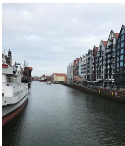
Fot. 3. Wyspa Spichrzów na Motławie