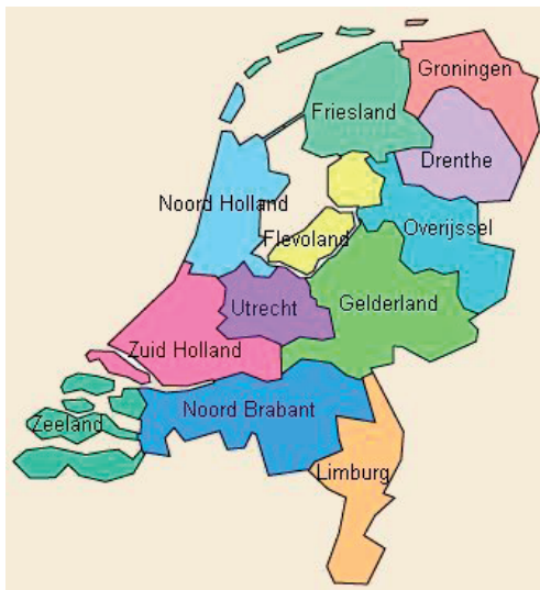
Ryc. 1. Podział administracyjny Holandii 24

i koordynację wspólnych zamierzeń. Dotyczą one komunikacji, lokalnych projektów ochrony środowiska, energetyki, w szczególności energii uzyskiwanej z odnawialnych źródeł, budownictwa mieszkaniowego itd. Takim programem realizowanym w ramach IPO jest „Piękna Holandia” ( Mooi Nederland ), którego cel to pogodzenie rozwoju gospodarczego z zachowaniem piękna krajobrazu, ochroną środowiska, rekultywacją terenów zniszczonych przez przemysł oraz promowaniem ekologicznych źródeł energii 23 .