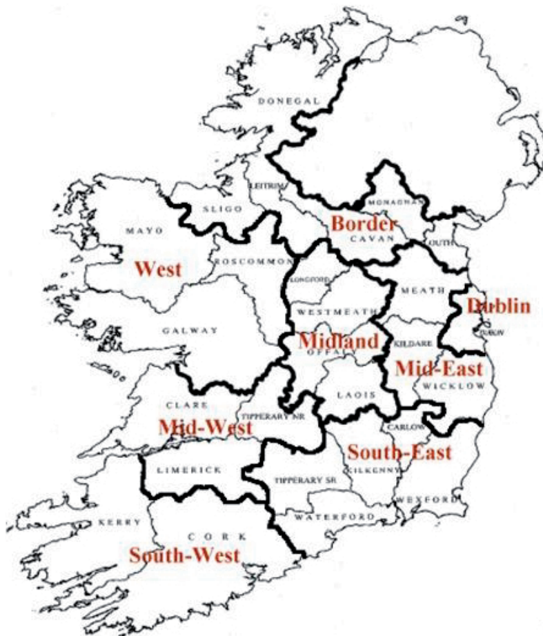
Ryc. 1. Podział Irlandii na 8 regionów

dopiero w 1999 r. Bunreacht na h'Éireann (Konstytucja Irlandii) z 1937 r. wzmiankowała bowiem jedynie o samorządzie w artykule 12.4.2., który dotyczył wyborów prezydenckich 11 .